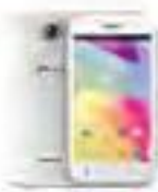
BLU advance dual sim Afl. 200.00